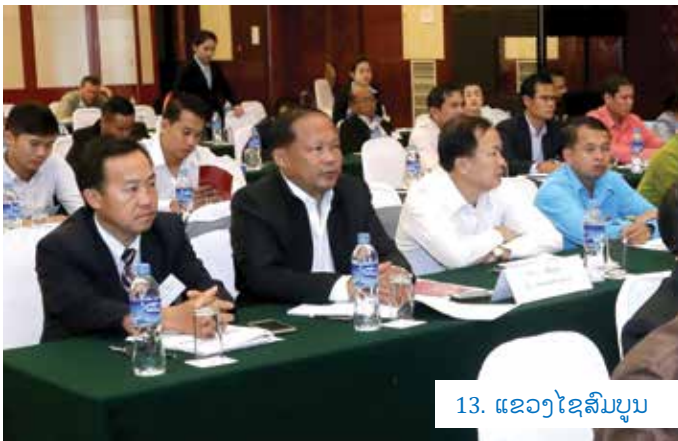
13. ແຂວງໄຊສົມບູນ