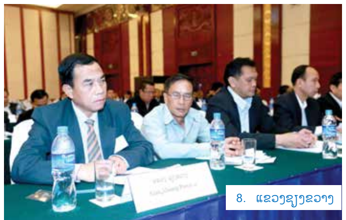
8. ແຂວງຊຽງຂວາງ