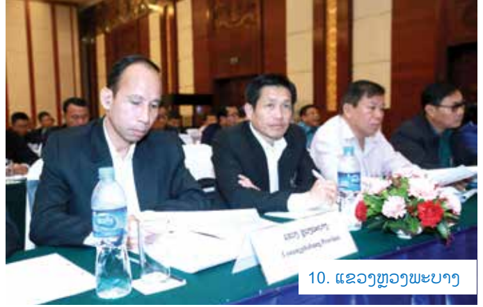
10. ແຂວງຫຼວງພະບາງ