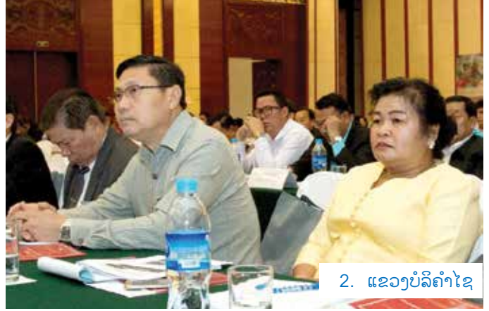
2. ແຂວງບໍລິຄຳໄຊ