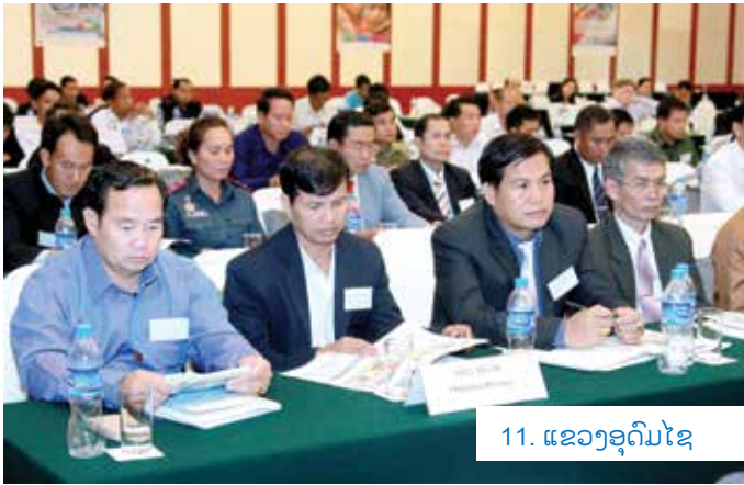
11. ແຂວງອຸດົມໄຊ