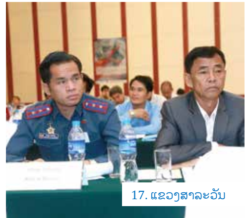
17. ແຂວງສາລະວັນ