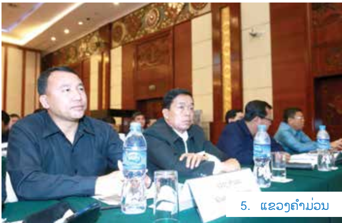
5. ແຂວງຄຳມ່ວນ