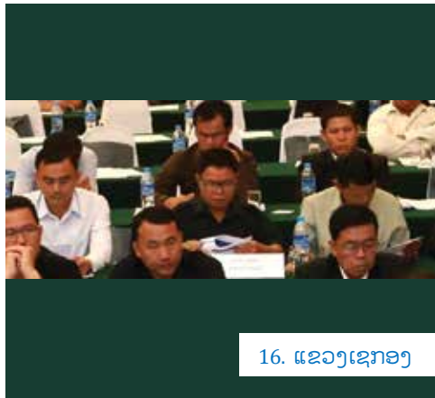
16. ແຂວງເຊກອງ