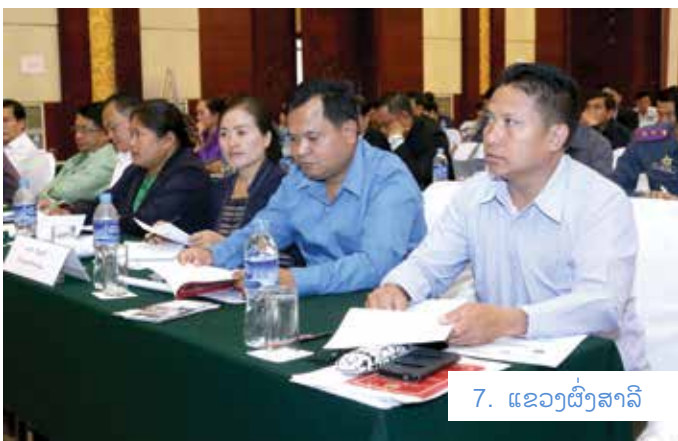
7. ແຂວງຜົ້ງສາລີ