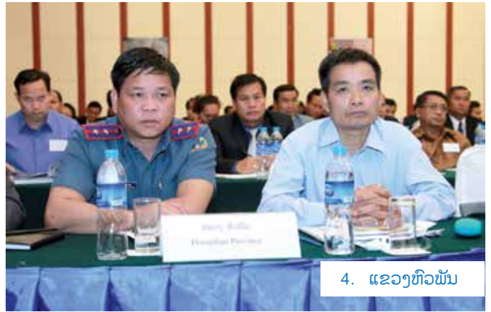
4. ແຂວງຫົວພັນ