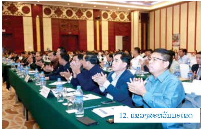
12. ແຂວງສະຫວັນນະເຂດ