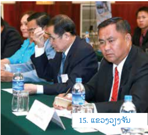
15. ແຂວງວຽງຈັນ