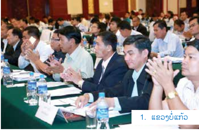
1. ແຂວງບໍ່ແກ້ວ