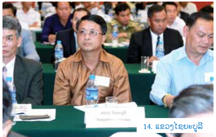
14. ແຂວງໄຊຍະບູລີ