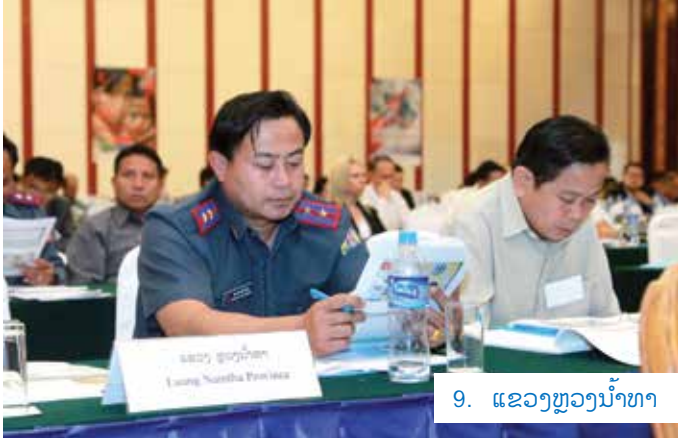
9. ແຂວງຫຼວງນ້ຳທາ