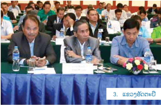
3. ແຂວງອັດຕະປື