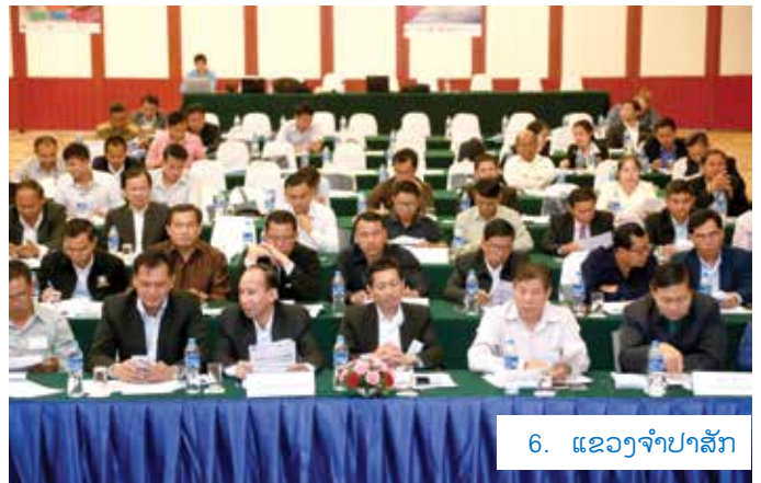
6. ແຂວງຈຳປາສັກ